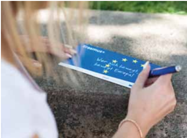
Das EU-Programm Erasmus erleichtert europäische Zusammenarbeit im Hochschulleben seit 30 Jahren. Auch die EH-Studierenden profitieren seit Jahren davon.

Freie Mobilität ist nicht immer und für jeden eine Selbstverständlichkeit. Die Freiheit, so mobil sein zu können, verdanken die EH Ludwigsburg und ihre Studierenden nicht zuletzt zahlreichen Förderprogrammen, beispielsweise dem DAAD oder der Baden-Württemberg Stiftung. Eines der bedeutendsten Programme im Bereich Hochschulkooperationen ist das Förderprogramm „Erasmus+“ der Europäischen Union. Als „Erasmus“ begann das Programm 1987 als Kooperation zwischen elf Staaten mit dem Ziel, den Austausch von Studierenden in Europa zu fördern. Mittlerweile umfasst das Programm alle Mitgliedsstaaten der EU sowie fünf weitere Staaten. Auch der Förderbereich ist gewachsen, seit im Jahr 2014 der Bereich Hochschulaustausch mit anderen Programmen der schulischen und beruflichen Bildung als „Erasmus+“ zusammengeführt wurde. Für die Internationalisierung an der EH spielt Erasmus eine bedeutende Rolle: Nicht nur gingen oder kamen allein über Erasmus bislang mehr als 350 Studierende ins Ausland oder aus dem Ausland. Auch Projekte wie die internationalen „Intensive Programs“ an der EH, Gastdozenturen oder Weiterbildungen an Partnerhochschulen für EH-Mitarbeitende kamen dank Erasmus zustande. Zum diesjährigen 30. Geburtstag von Erasmus möchten wir darum auch von Seiten der EH Ludwigsburg herzliche Glückwünsche aussprechen.