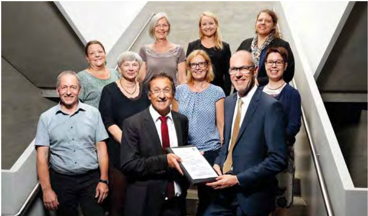
Ziehen neu an einem Strang: Die Altenpflegeschule der Ludwigsburger Mathilde-Planck-Schule und der Pflegestudiengang der Evangelischen Hochschule.