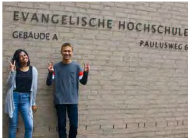
Der Austausch zwischen unserer Partnerhochschule in Indonesien ist keine Einbahnstraße. Incoming- und Outgoing-Interessierte werden vom International Office beraten.

Mobilität bringt Verantwortung mit sich. Wichtig ist darum bei dieser Gelegenheit nicht nur ein Rückblick, sondern auch ein Blick nach vorn. „Wer sich bewegt, bewegt Europa!“, so das Motto des Erasmus-Programms. Sich und andere weiter zu bewegen – das ist Aufgabe der Studierenden und Mitarbeitenden an der EH Ludwigsburg. Dafür müssen jedoch nicht immer Hunderte von Kilometern überbrückt werden: Die Internationalisierung unse-