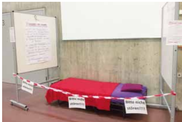
Keine Ausnahme in der Vorlesungszeit: Studieren von 8:00 bis 19:00 Uhr. Ruheräume sind oft überbelegt, die Barriere weist mit Feldbetten auf die Lage hin.