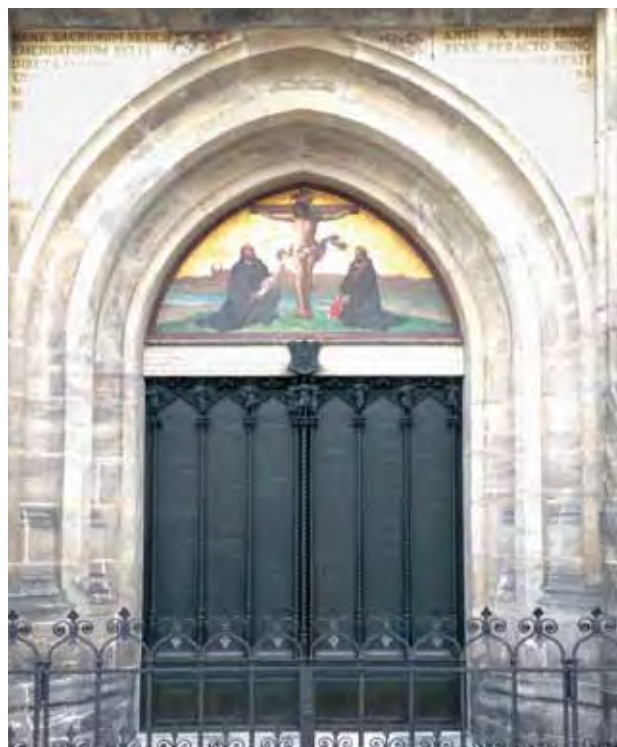
Dies ist die sogenannte Thesentür der Wittenberger Schlosskirche, frisch poliert im Sommer 2017.

Diese reformatorische Erkenntnis ist zeitunabhängig gültig und eine Zusage und ein Grundauftrag für alle ChristInnen, wie für die (evang.) Kirche als Ganzes. Gibt es eine schönere, eine hoffnungsstiftendere (Freiheits-)Botschaft für (Christen)Menschen? Gibt es einen schöneren Auftrag für eine Evangelische Hochschule, als sich dieser Botschaft und Aufgabe verpflichtet zu sehen?