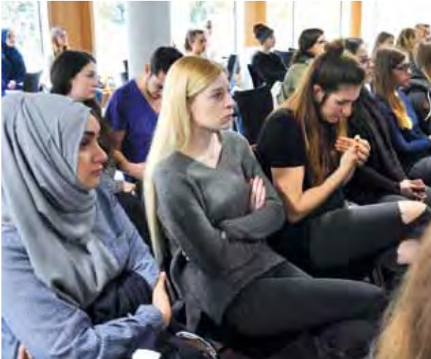
Die (Bildungs-)Freiheit in Deutschland wird von jungen Leuten geschätzt. Im Wintersemester 2017/18 studieren so viele Menschen im 1. Semester wie noch nie: 295.

wird, steht auch beim Bildungsprozess unserer Klienten und Klientinnen der Kompetenzerwerb im Fokus. Alle sollen ihr Potential bestmöglich nutzen und die Dinge lernen, die für sie entlang ihrer „Zone der nächsten Entwicklung“ (Wygotski 1987, 83) bedeutsam sind. Entscheidend ist das individuelle Lernen in einer interaktiven Situation, bei dem Lehrende und Lernende gegenseitig voneinander lernen und der Prozess im Mittelpunkt steht. Demgegenüber ist es der Auftrag der Lehramtsstudierenden, die Bewertung der Leistungsfähigkeit ihrer Schüler und Schülerinnen in den Mittelpunkt des Unterrichts zu stellen. Sie vergleichen eher die dem Curriculum entsprechende Leistungsfähigkeit der Kinder und bewerten weniger den individuellen Lernfortschritt des einzelnen Kindes. Dies ist ein Beispiel für unterschiedliche Sichtweisen zwischen den Professionen, die im Feld der beruflichen Zusammenarbeit zu Konflikten führen können. Die Freiheit der Klientinnen und Klienten wird professionstypisch hier auf verschiedene Weise berücksichtigt. Der Austausch von Sichtweisen aller Beteiligten ist essentiell, um Konflikte im Berufsfeld zu bewältigen und zu einem gegenseitigen Verständnis zu gelangen. Auf diese Weise werden eine Annäherung und möglicherweise auch ein Sichtwechsel möglich. In jedem Fall kann der individuelle Horizont durch eine neue Sichtweise erweitert werden.