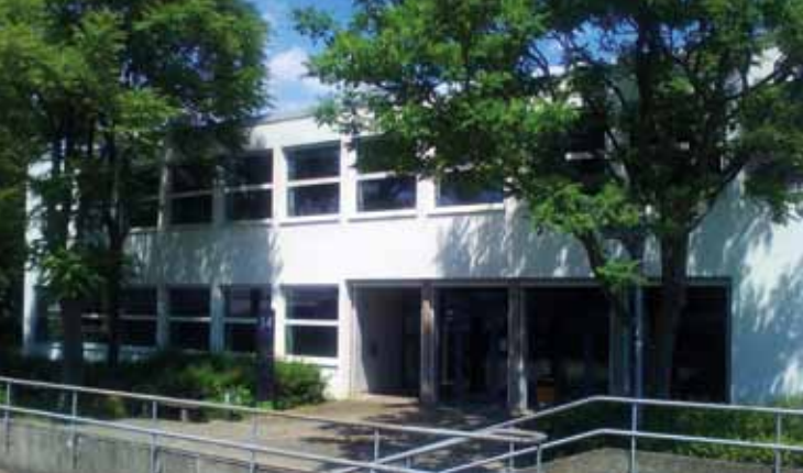
Das Gebäude Campus Reutlingen