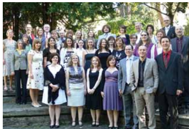
Feierlicher Abschluss des Studiums: Die Einsegnung in das Kirchenamt der Diakonin und des Diakons.

Die beiden Masterstudiengänge, die in Kooperation mit der Universität Heidelberg und den beiden Hochschulen in Freiburg und Darmstadt angeboten werden, bieten Perspektiven für eine weiterführende Qualifikation. Das gilt auch für weitere Angebote, die die EH im Rahmen des Instituts für Fort- und Weiterbildung und in Kooperation mit der Stiftung Karlshöhe anbietet. Die Anzahl an Bewerbungen für die Studiengänge ist stabil. Noch immer kommen zahlreiche Bewerber/innen aus der kirchlichen Kinder- und Jugendarbeit der Landeskirche. Neben dieser konstanten Bewerbungsgruppe kommen nach dem diesjährigen Bewerbungsverfahren eine wachsende Zahl von