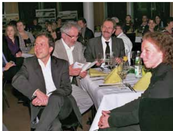
Ein Abend für alle Sinne war das erste Dekadefest der Hochschule: Musik, Essen und Tanz für alle Hochschulangehörigen und Freunde der EH.

Daneben wurden die Personalangelegenheiten in den MAV-Sitzungen und den regelmäßigen Treffen mit der Dienststellenleitung geklärt. Der Vorsitzende vertrat darüber hinaus die EH Ludwigsburg in den Gremien der Landeskirche wie der LaKiMAV, der Teilvollversammlung und der Gesamt-MAV der kirchlichen Dienststellen.