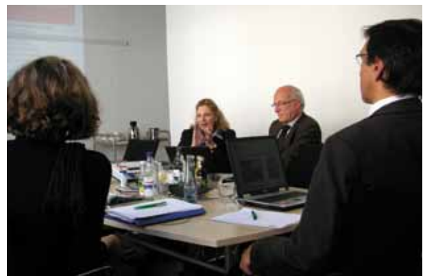
Erste Gespräche zum neuen Benchmarking-Club fanden im Sommer in Räumen des IAD statt

kirchliche Akademien, staatliche Berufsakademien, Fachschulen für Sozialpädagogik und Hochschulen