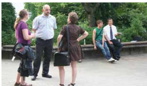
Neudeutsch Networking, schwäbisch Zamma schwätza – beim Fest des Freundeskreises war beides möglich.

richtungen studiert, gelehrt oder gearbeitet hat oder dies gegenwärtig tut (Jahresbeitrag: 12 €, Mitgliedsformular: www.eh-ludwigsburg.de/freundeskreis ).