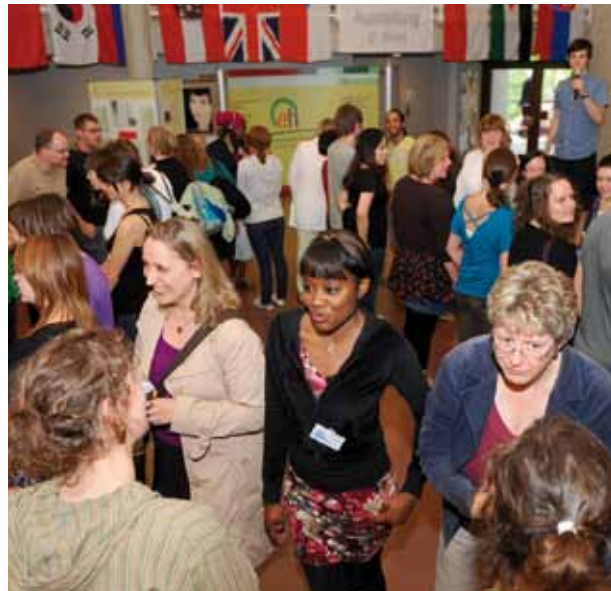
Professors and students welcome international guests at the opening of the Erasmus Summer Intensive Program.

fice of the EH Ludwigsburg as project proponent. It is a three year project involving partner and guest universities: Newman University College – England; JABOK Social Work College – Czech Republic; Jan Dlugosz University – Poland; Kempen College – Belgium; Hogeschool Zuyd – Netherlands and Diaconia University of Applied Sciences – Finland. The third summer academy in 2011 will be coordinated by Diaconia University of Applied Sciences in their Järvenpää campus. The summer academy in 2011 will once again bring 30 international students with all their diverse characteristics together in order to live, work, study and negotiate their differences in a social learning laboratory. It is a two week living experience dealing with the difficult questions of diversity and how social cohesion is achieved in respectful inclusion of difference.