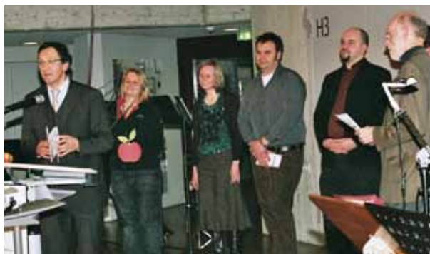
Die ersten Mitglieder des Freundeskreises „pflanzen“ ein Apfelbäumchen