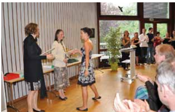
Im Sommersemester gab es letztmalig Zeugnisse in der Gruppe des Diplomergänzungsstudienganges „Sozialpädagogik“