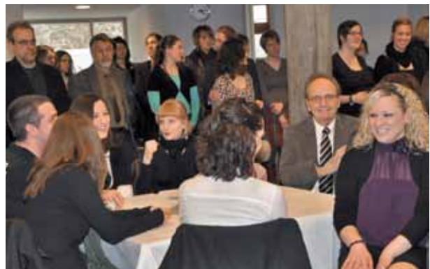
128 Studierende feierten mit ihren Angehörigen die Zeugnisübergabe