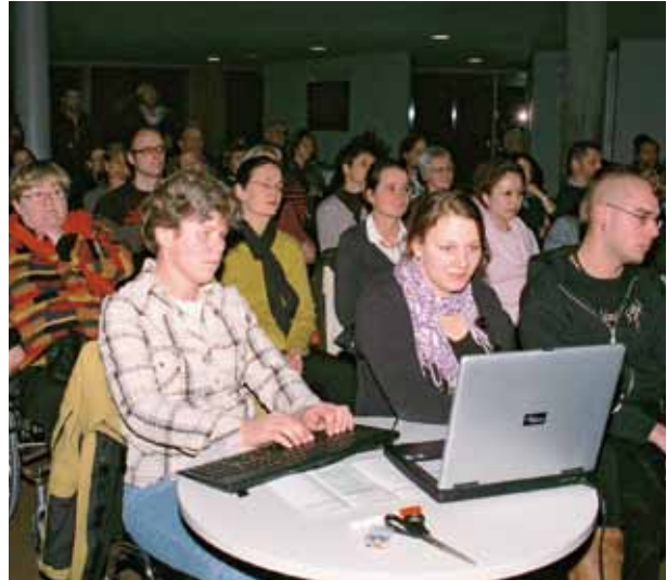
Zahlreiche Landtagsabgeordnete diskutieren an der Hochschule mit Betroffenen die Umsetzung der UN-Konvention für Inklusion in Ludwigsburg.

Die historischen Entwicklungen in der Heilpädagogik verdeutlichen, dass die inhaltliche Ausrichtung der Studiengänge eine integrative und inklusive Pädagogik erfordert. Wesentliche Gründe liegen in der Erkenntnis, dass die Gestaltung eines gemeinsamen Lebens für alle Bürgerinnen und Bürger einen Gewinn bringen kann