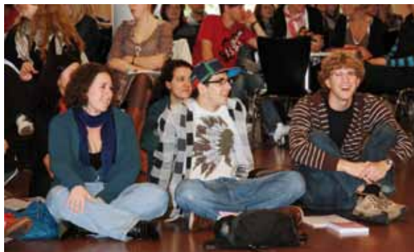
In zahlreichen Gremien der Hochschule, wie dem Fachbereichsrat, engagieren sich unsere Studierenden (Foto zeigt studentisches Treffen) ehrenamtlich.